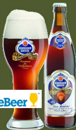
Schneider Tap 6 (Germania) – weizen bock

Beri nefiltrate care au la bază malț din grâu, la fel ca cele de tip hefeweizen, doar că au nivelul de alcool ridicat. De obicei au o aromă complexă, conferită de esterii eliberați de drojdie și o corpolență crescută, dată de malț.