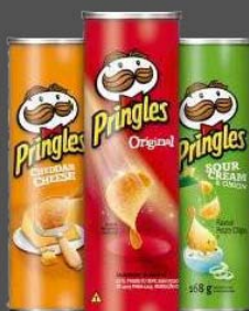
Pringles 165 grame - 12 lei