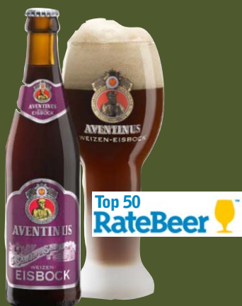
Aventinus Eisbock (Germania) - eisbock

Aventinus Doppelbock din Bavaria este cunoscută ca fiind cea mai intensă și complexă bere de grâu din lume. Până în anii 1940 berea era transportată în Bavaria în recipiente lipsite de control al temperaturii. În consecință, lichidul a înghețat parțial în timpul transportului. Practic, fără ca cineva să-și propună, alcoolul și aromele din bere au devenit foarte concentrate deoarece temperaturile scăzute au separat apa de restul lichidului. Astfel, printr-o banală întâmplare, primul Aventinus Eisbock a fost creat. Șaizeci de ani mai târziu, berarul șef al fabricii de bere Schneider a decis să recreeze "greșeala de transport" într-o instalație modernă. Rezultatul? Aventinus Eisbock, o bere extrem de apreciată. Gust caramelizat, de melasă, urme de vin de porto. Nefiltrată și fără conservanți. Schneider Weisse