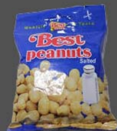
Best peanuts cu sare 50 grame - 5 lei