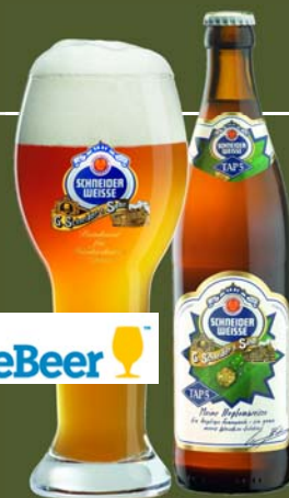
Schneider Tap 5 (Germania) – weizen bock

Nota Beer Zone: De încercat măcar o dată în viață!