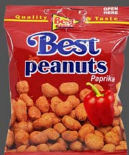
Best peanuts cu paprika 50 grame - 5 lei