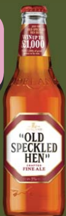
Old Speckled Hen (Scoția) – premium bitter

Aspect chihlimbariu și limpede, cap alb și subțire de spumă. Gust de cereale cu note caramelizate, dominat de o amăreală plăcută. Corp mediu, textură cremoasă, carbonatare scăzută. Greene King