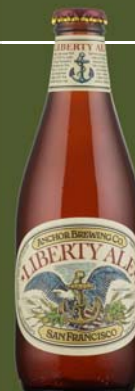
Anchor Liberty Ale (SUA) – american pale ale

Culoare aurie, corp mediu de spumă. Miros de ierburi și hamei proaspăt. Dezvoltă note florale, o ușoară dulceață de malț, amintește de pâine și biscuiți. Finalul este moderat amar. O bere excelentă, ușor băubilă. Anchor Brewing Company