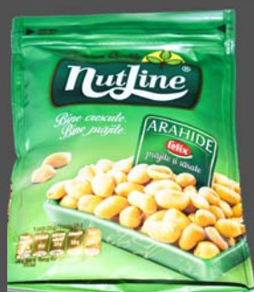
Arahide nutline 150 grame - 9 lei