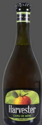
Cidru Harvester mere (Romania)

Băutură alcoolică fermentată, obținută 100% din suc de mere, fără zahăr adăugat.