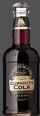
Fentimas Curiosity Cola (Anglia)

Cola botanică obținută prin fermentare cu extracte de plante și ghimbir