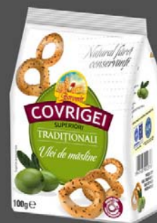
Covrigei horomir 100 grame - 5 lei