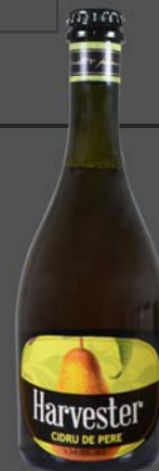
Cidru Harvester pere (Romania)

Băutură alcoolică fermentată, obținută 100% din suc de pere, fără zahăr adăugat.